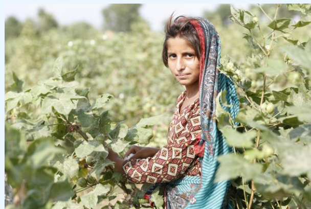
Jeune femme dans un champ de coton lors d'une formation © OIT, 2021.

travail des enfants et du travail forcé. Les efforts de reconstruction doivent inclure des programmes d'aide à l'emploi et aux moyens de subsistance qui soient respectueux des principes et droits fondamentaux au travail, afin d'atténuer ces vulnérabilités.